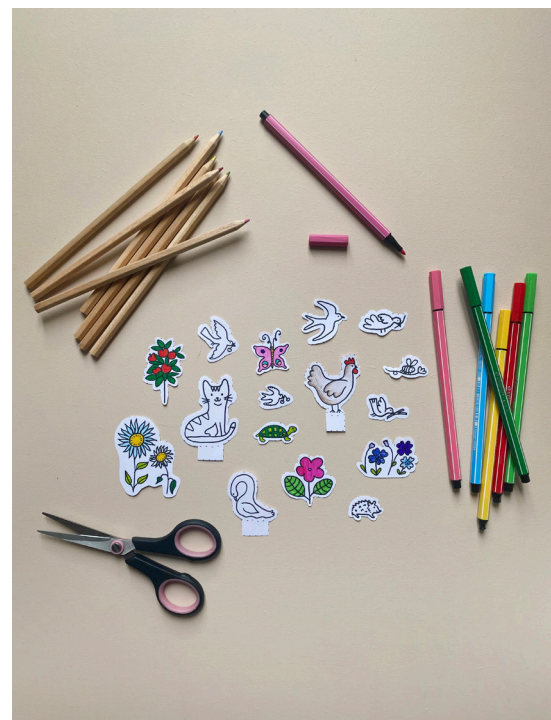
4- Découper et colorier les éléments du printemps.