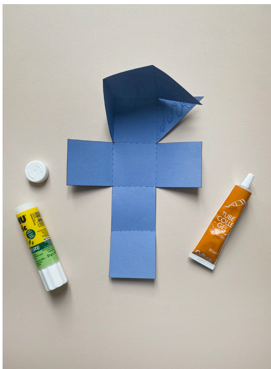
3- Coller les triangles de chaque côté de la boîte entre eux.