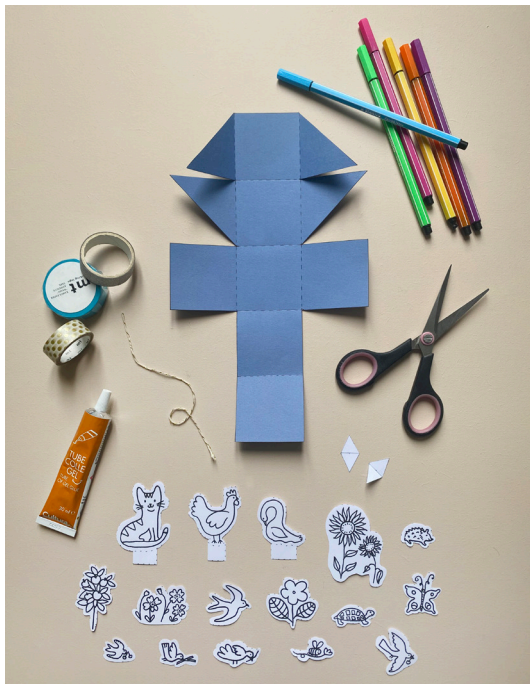
1- Rassembler le matériel nécessaire.